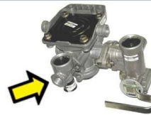
2-Leitungsanlagen inkl. Löseventil automatisch!